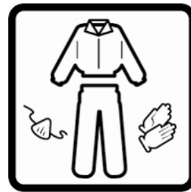
Cobrir a pele exposta. Usar máscara se a zona não estiver ventilada.